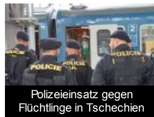
Polizeieinsatz gegen Flüchtlinge in Tschechien