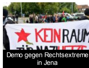
Demo gegen Rechtsextreme in Jena

Temme bestritt, dass er Mitgliedern der Kasseler Neonazigruppe „Sturm 18“ über seine Tätigkeit im Verfassungsschutz oder seinen Dienstsitz informiert habe. Der