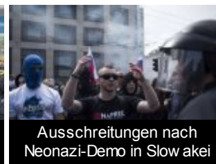
Ausschreitungen nach Neonazi-Demo in Slowakei