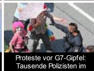
Proteste vor G7-Gipfel: Tausende Polizisten im Einsatz