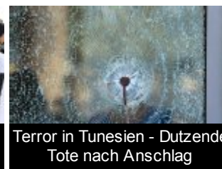
Terror in Tunesien - Dutzende Tote nach Anschlag