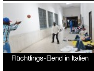
Flüchtlings-Elend in Italien