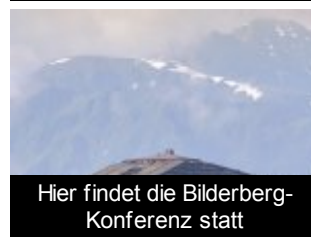
Hier findet die Bilderberg-Konferenz statt